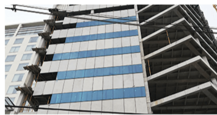
MANTENIMIENTO general de fachadas