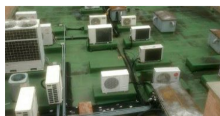
TECHOS y cubiertas

Nuestros servicios se dirigen a campos de la Construcción, Industrial, Nuevos Proyectos, Entidades Gubernamentales y Vivienda para mantenimiento.