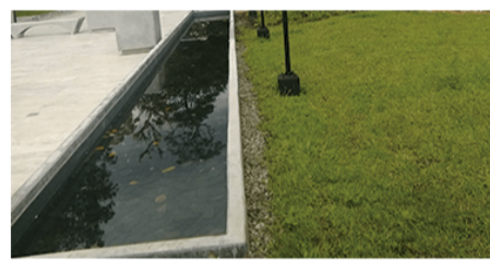
REFORMAS y obras civiles