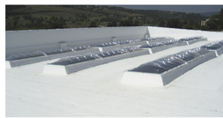
CONSTRUCCIÓN liviana de cielos y muros