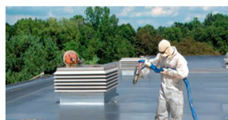
SISTEMAS ADHERIDOS uretano térmico - caucho - sílica